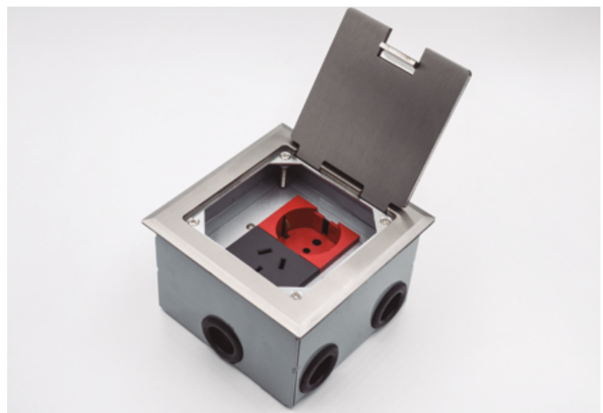
1734: Tapa en bronce.