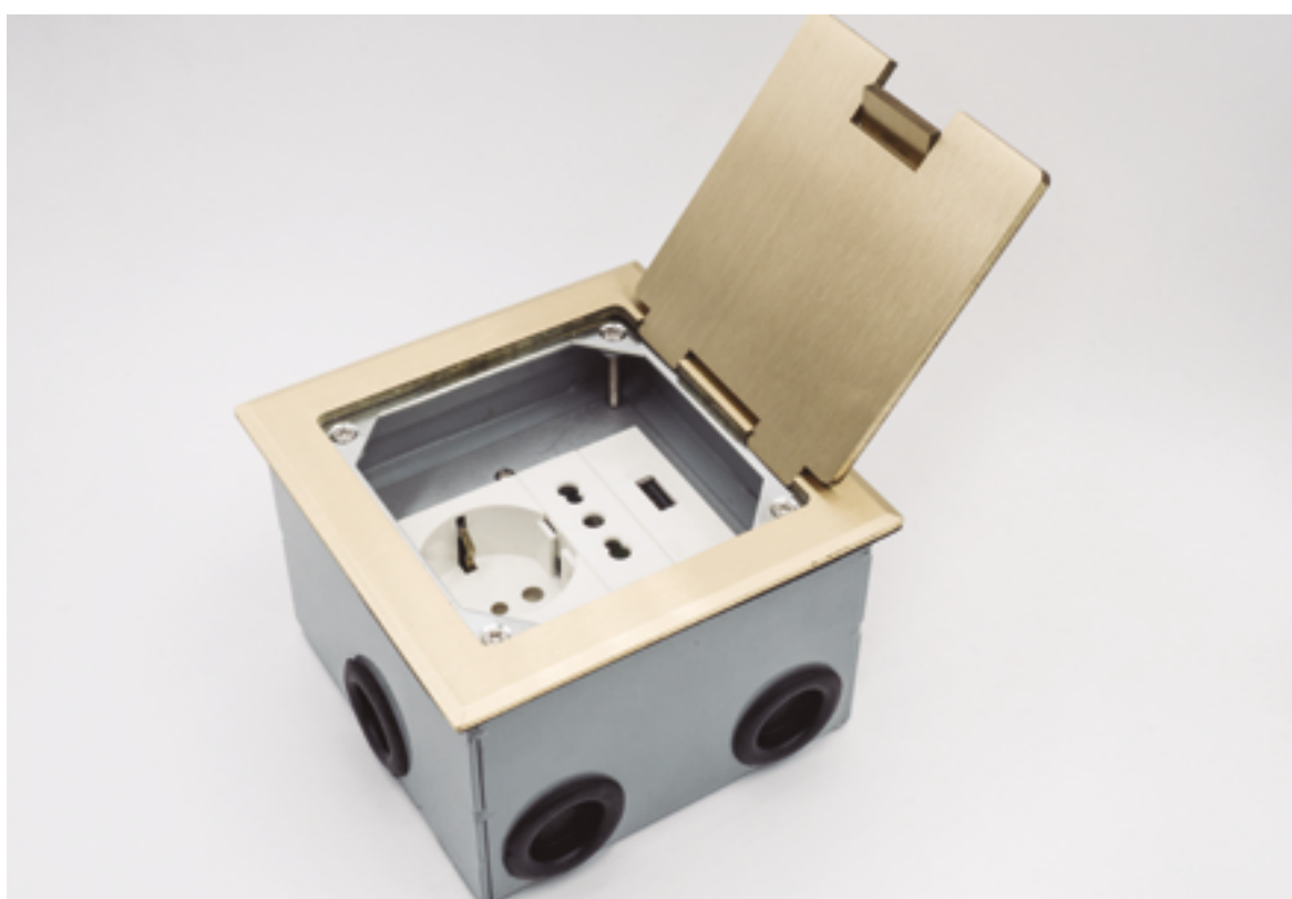
1734: Tapa en bronce.